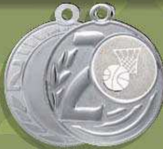
código 55-5361 Med. ø 50 Mor. ø 25