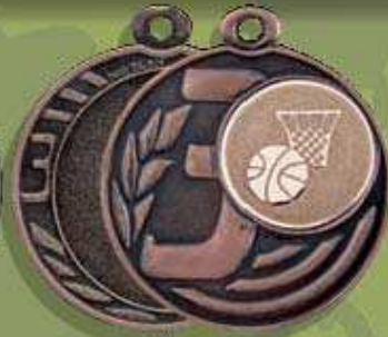
código 55-5378 Med. ø 50 Mor. ø 25