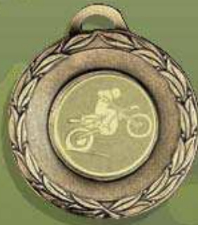
código 23-6616 Med. ø 50 Mor. ø 25