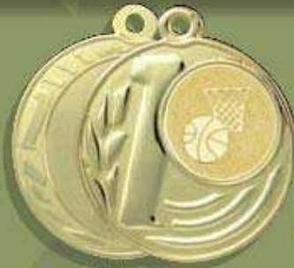
código 55-5350 Med. ø 50 Mor. ø 25