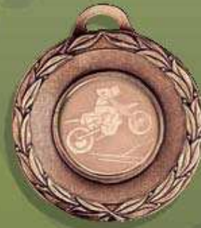
código 23-6618 Med. ø 50 Mor. ø 25