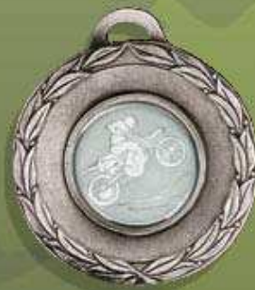
código 23-6617 Med. ø 50 Mor. ø 25